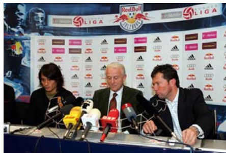
Verschieben aller Mikrofone