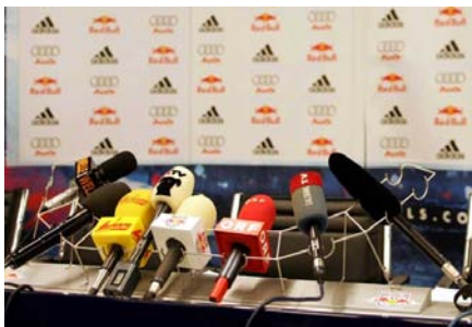
Aufbau der Pressemikrofone

zum Verschieben aller Pressemikrofone auf einmal