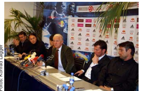
Nächster Redner spricht